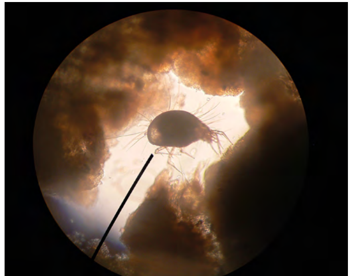
Mikroskopische Aufnahme einer Vorratsmilbe, die häufig ein Auslöser für die atopische Dermatitis ist.

Für den praktizierenden Tierarzt wie auch für den Patienten(-besitzer) ist der Erfolg einer Therapie entscheidend. Aus den Ergebnissen einer eigenen Studie geht hervor, dass mit einer individuellen Allergen-spezifischen Immuntherapie bei über \frac{3}{4} der Patienten mit atopischer Dermatitis eine deutliche Besserung der klinischen Symptomatik bis hin zur Symptombefreiheit erzielt werden konnte. Dies deckt sich weitgehend mit den Literaturangaben, die den Therapieerfolg der Allergen-spezifischen Immuntherapie mit 70 – 80 % angeben. Die Ergebnisse zeigen weiterhin, dass diese Erfolgsaussichten durch frühzeitige Diagnosestellung (Intrakutan- oder Serumtest bei vorliegender klinischer Symptomatik) und anschließend raschem Therapiebeginn deutlich erhöht sind. Auch der positive Effekt begleitender Maßnahmen wie z. B. Allergenreduktion in der Umgebung des Tieres ist unbestritten, während Rasse und Geschlecht des Patienten keinen Einfluss auf den Therapieerfolg zu haben scheinen.