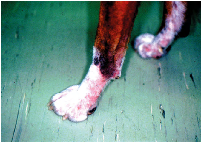
Juckreiz im Pfotenbereich bei einem atopischem Hund

Bei nahezu keinen Nebenwirkungen stellt die Allergen-spezifische Immuntherapie derzeit die vielsprechendste aller Therapieformen dar. Bis zu \frac{1}{4} der Probanden, die auf die Therapie ansprachen, war unter der Behandlung symptomfrei und über \frac{3}{4} der Patienten mit Therapieerfolg zeigte eine deutliche Verbesserung von Juckreiz und Dermatitis.