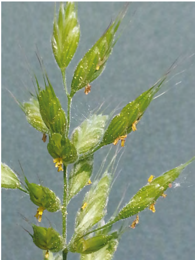
Pollen sind häufig Allergieauslöser.

Die Allergen-spezifische Immuntherapie ( ASIT ), auch Hyposensibilisierung genannt, ist eine erfolgreiche Behandlungsmöglichkeit der CAD (canine atopische Dermatitis), aber auch bei Katzen mit Allergie auf Umgebungsallergene . Der erste Bericht beim Hund mit „saisonaalem Heuschnupfen“ stammt aus dem Jahre 1941.