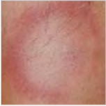
Ringförmige Rötungen der Haut nach einem Zeckenstich

HGA-Patient fühlt sich matt und abgeschlagen. Die Übertragung findet über infizierte Zecken statt. Die Verbreitung der Anaplasmen in Deutschland ist regional sehr unterschiedlich und hängt u. a. von der Nagetierpopulation ab. Eine direkte Übertragung von Mensch zu Tier oder von Tier zu Mensch ist bei der FSME , der Borreliose und der Anaplasmose nicht bekannt. Auch der Hund kann an diesen Krankheiten leiden. So äußert sich die Anaplasmose beim Hund u. a. durch Fieber und Abgeschlagenheit.