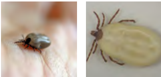
Vollgesogener Holzbock (links) und vollgesogene Igelzecke (Ixodes hexagonus)

Alle Entwicklungsstadien der Zecke können das Virus beim Blutsaugen übertragen. Das Virus selbst ist in den Speicheldrüsen der Zecken und kann bereits mit Beginn des Saugaktes in den Wirt eingebracht werden. Allerdings bedeutet der Stich einer Zecke nicht automatisch eine Infektion.