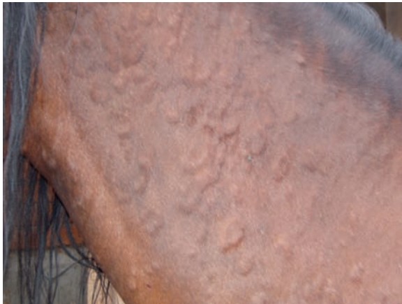
Abb. 1: Der Quaddelausschlag beim Pferd kann mannigfaltige Ursachen haben und auch durch ein Allergen im Futter ausgelöst werden.

Yu, AA, Rosychuk, RA (2013): Veterinary Clinics of North America: Equine Practice Volume 29, Issue 3, Pages 541-716, Equine Dermatology